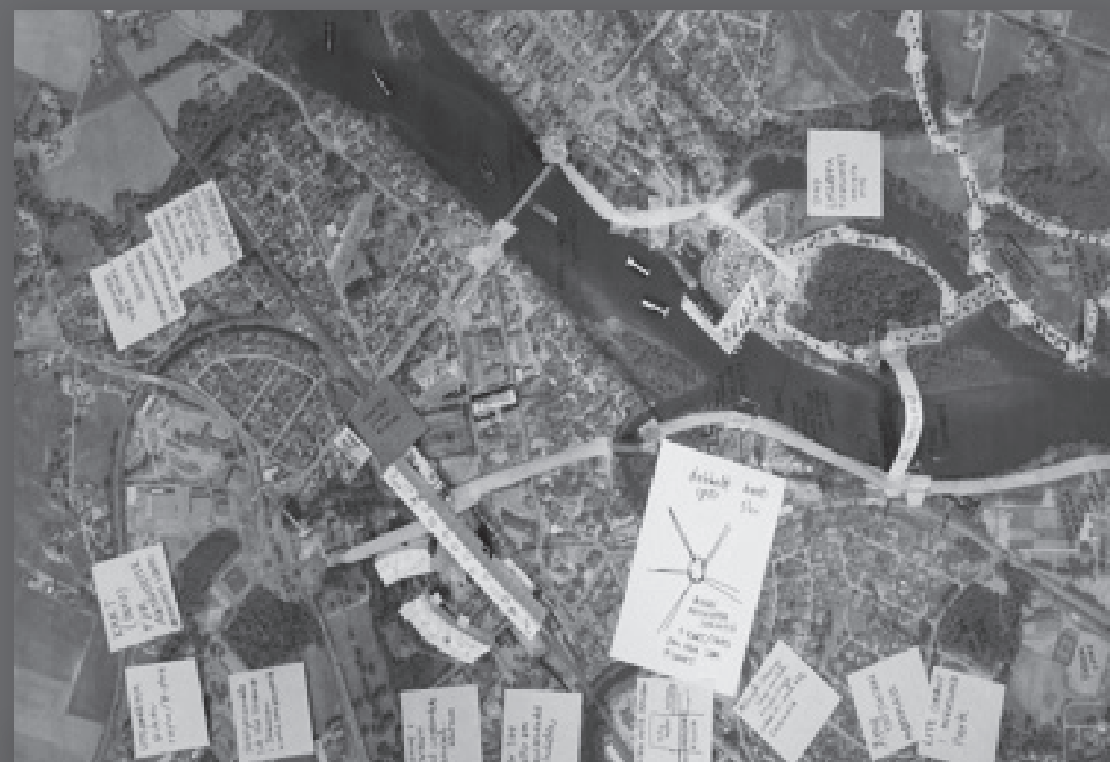
Nápady a plány budoucího centra města

Konference prarodičů vyzývá starší občany k tomu, aby využili své schopnosti a zkušenosti ve službě mladším generacím. Koná se každý druhý rok v místních školkách. Mnoho prarodičů sem přijde děti navštívit a poskytnout jim podporu; provádějí je po naučných vycházkách, provádějí s nimi údržbářské práce a společně čtou.