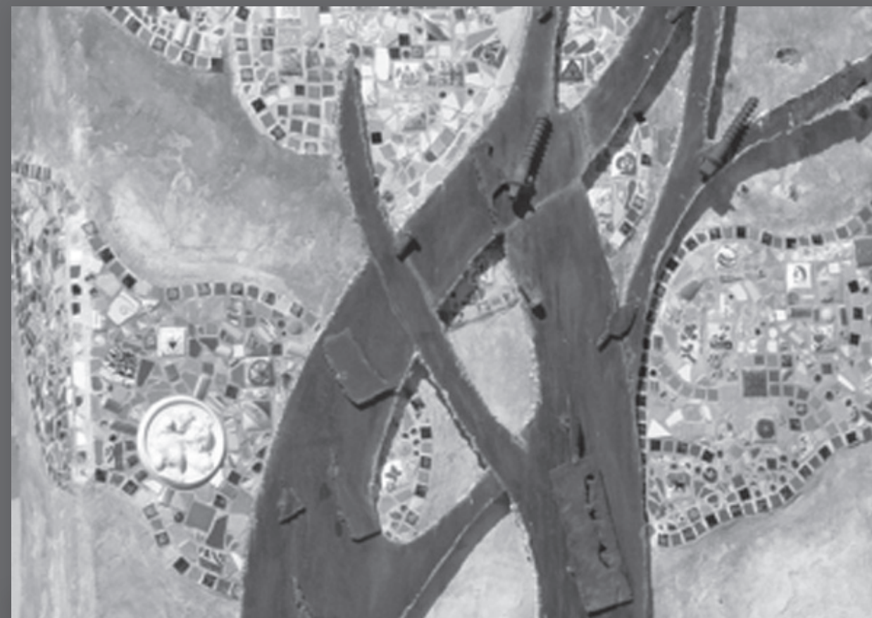
Komunita a vize – část mozaiky na zdi