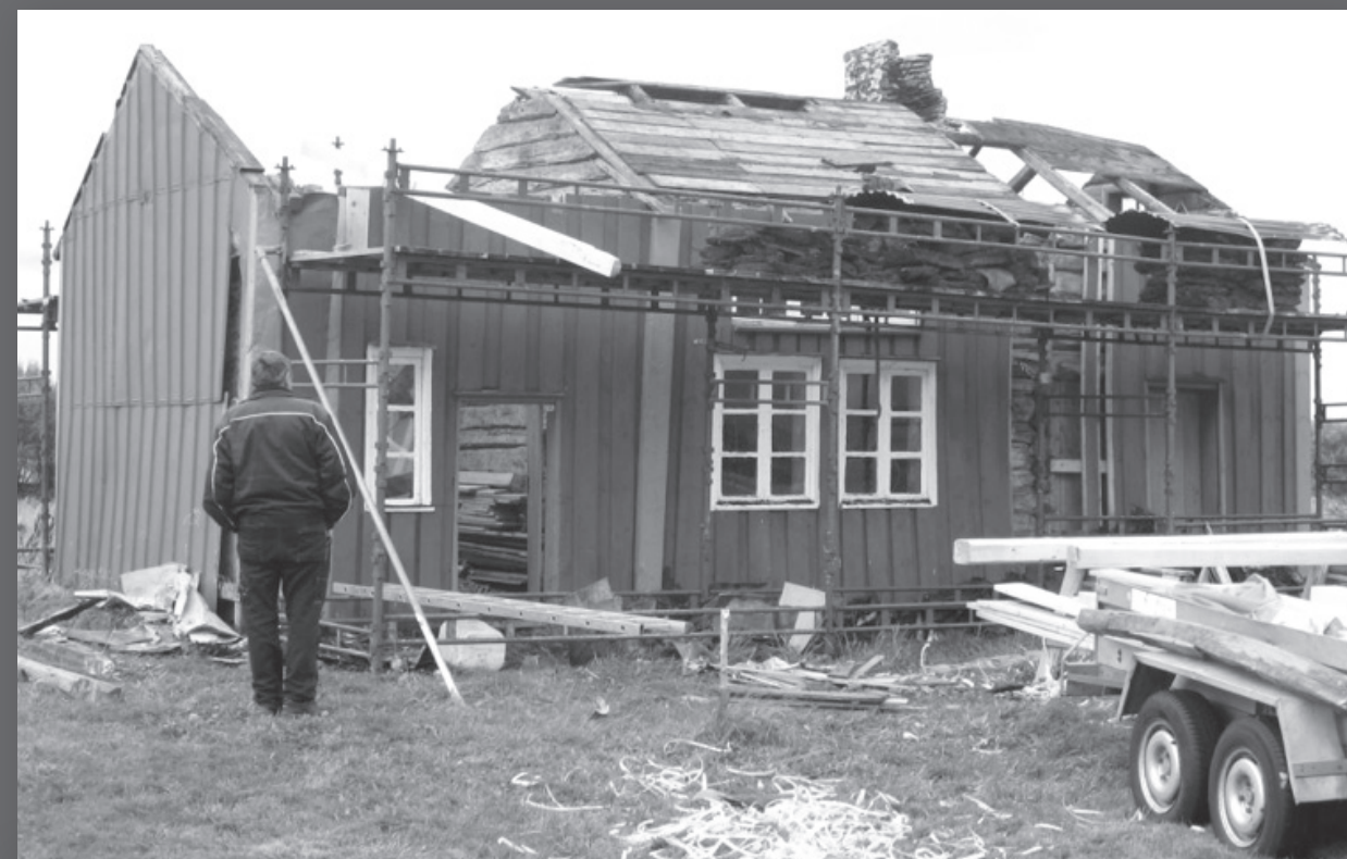
Fræna: Rekonstrukce „Massinastua“, rybářského domku postaveného kolem roku 1870.

Konkrétním výsledkem celostátního programu „Živoucí komunity“ je, že součástí rozvojového plánu kraje Møre og Romsdal, který vzniká v letech 2009 až 2012, je cíl vypracovat „nejambicióznější politiku dobrovolnického sektoru v celém Norsku.“