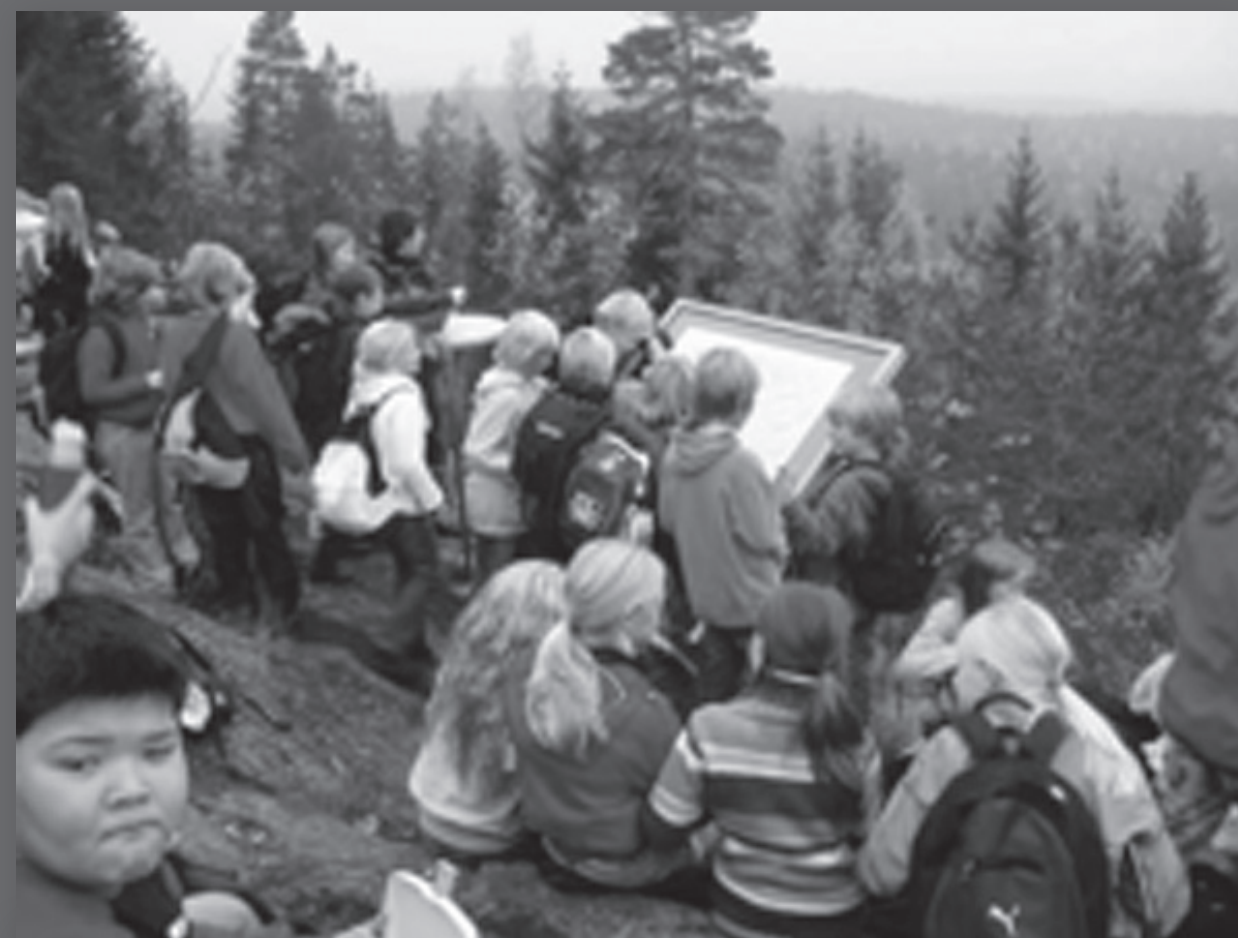
Dětské kresby přitahují velikou pozornost, a to nejen od rodičů zúčastněných dětí. Jedna z mnoha vycházek s průvodcem – informace a vzdělávání

Příklady osvědčených postupů a metod účasti jsou důležité pro inspiraci a stimulaci povědomí o cestách, jež vedou k demokratické a trvale udržitelné budoucnosti.